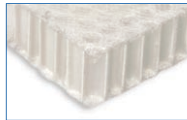
Alveolare in polipropilene